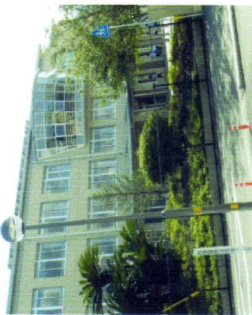
まだ新しい川島中学校舎

市の教育委員会は、市内の小中学校を再編するために、「学校再編計画策定委員会」を設置し、昨年十一月末から本年九月末までに八回の委員会を開き、二四年度中に計画案をまとめる予定です。 計画案はすでに骨格が見えていますが、その中には川島中学校を山川中学校に編入して、空いた中学校校舎を川島小学校と学島小学校を統合した「新川島小学校」にすることになっています。